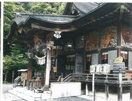
拝殿正面 (今回修理前状況)