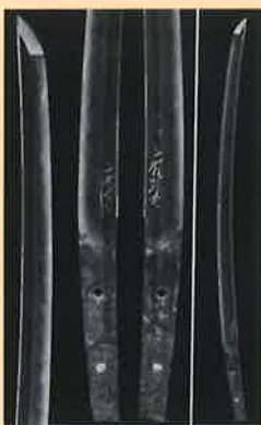
秩父神社脇差（勝光・宗光）埼玉県立博物館 特別展「武蔵ゆかりの武器・武具」図録より転載

これを記念し、同刀を所蔵する埼玉県立歴史と民俗の博物館の学芸員による歴史講座を開催します。