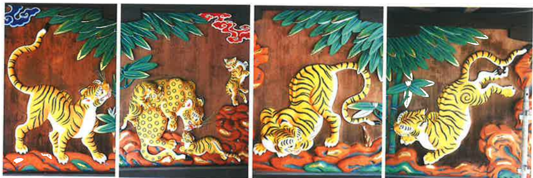
拝殿正面彫刻 虎 (修理状況)