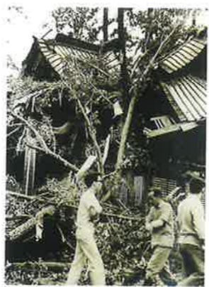
昭和41年台風被害状況 拝殿半壊